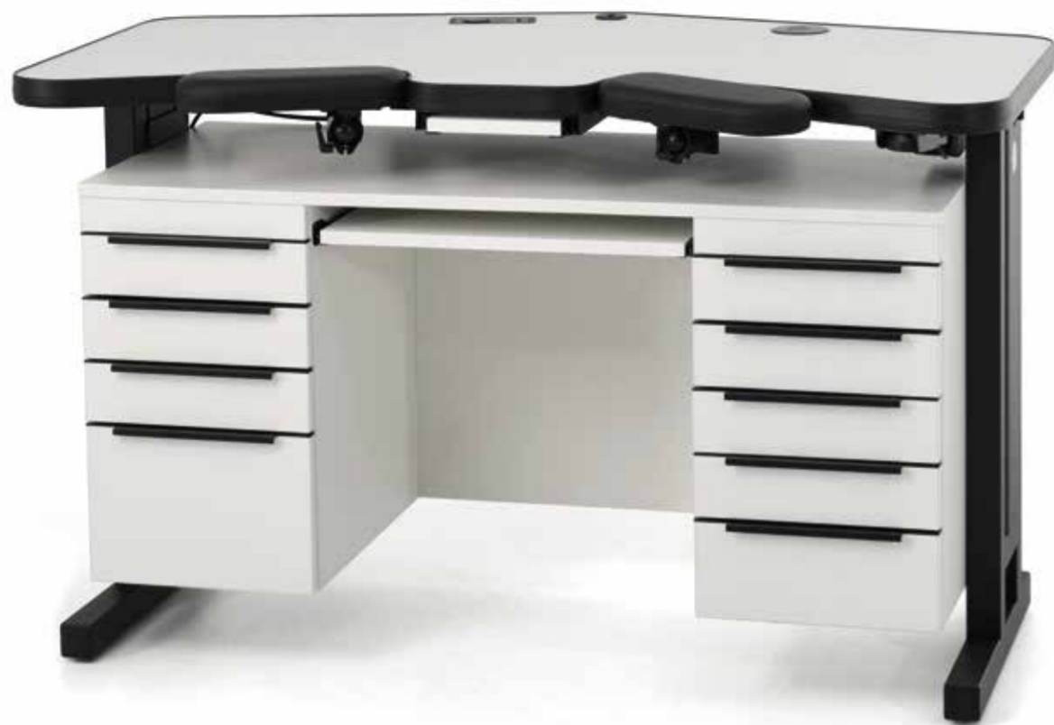
Der Uhrmacherwerkstisch „DELTA-FUTURA-TEAM“ hat eine 145 x 82,5 x 4 cm große, lichtgraue Arbeitsplatte, die augenschonend ist, sowie zwei Armauflagen mit 3D-Gelenken.