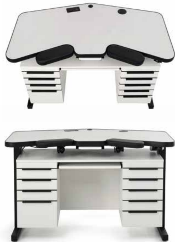
Der Tisch ist elektrisch stufenlos in der Höhe von 88 bis 134 Zentimeter verstellbar und passt so ideal zu jedes Juweliers persönlicher Körpergröße.