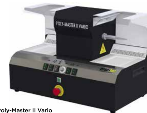
Der Poliermotor Poly-Master II Vario ist eines der stärksten Poliergeräte, die es am Markt gibt, und hat eine Staubabsaugkraft von 95 Prozent.

gebracht werden. So ist der Tisch temporär auch als Steharbeitsplatz nutzbar. Ein Kombi-Druckluft/Vakuumverteiler mit integriertem/automatischem Rückholssystem kann gegen Aufpreis integriert werden.